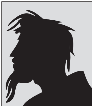
Portret van een activist

over zijn werkterrein verraaft. T. houdt zich vooral bezig met het dierenrecht en is hierbij nationaal en zelfs internationaal betrokken. In zijn strijd tegen het dierenleed is hij zeer gedreven en zelfs gewelddadig, als dat – in zijn ogen – moet. Vermoed wordt dat hij zelfs betrokken is bij gewelddadige huisbezoeken. T. is verantwoordelijk voor kleine acties, zoals het belemmeren van de toegang tot de slager, tot grotere acties, zoals de organisatie van demonstraties. Hij is zeer intelligent – hij heeft een universitaire studie afgerond – en bovendien scherp en welbespraakt. Hij treedt dan ook vaak