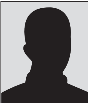
Portret van een hooligan

A. is begin dertig en al ruim vijftien jaar actief in de harde kern van Feyenoord. Op zijn schouder heeft hij een tatoeage die verwijst naar zijn club. Hij heeft de opleiding LTS-bouwkunde afgerond, maar werkt nu voor een verhuisbedrijf. A. begon bij de jonge garde van Feyenoord. Door zijn deelname aan het 'Fighting Squadron', de vechteenheid van de harde kern, en het regelen van tickets en vervoer bij uitwedstrijden heeft hij zich opgewerkt tot een van de hoofdfiguren van de 'Feyenoord derde generatie Rotterdam hooligans' (FIIIR). Maar ook op festivals en