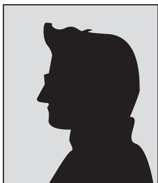
Portret van een wijkverstoorder

F. staat bekend als een grote onruststoker in de wijk. Vooral de politie in de wijk moet het ontgelden, daarnaast staat hij erom bekend vrouwen lastig te vallen. Hij is van Marokkaanse afkomst, 22 jaar en woont thuis bij zijn ouders, drie broers en zusje. Zijn vader is al enige tijd werkloos. F. werkte enige tijd in een sportwinkel, totdat bleek dat hij de kluis had leeggeroofd. Sindsdien maakt hij zich veel schuldig aan uiteenlopende criminaliteitsvormen, waaronder woninginbraken. Vrijwel alles pleegt hij in groepsverband. Ook zijn broers zijn crimineel actief, maar komen veel minder in