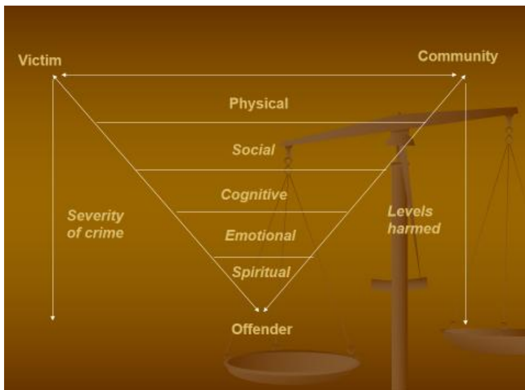
Figuur 7.2. Driehoek met lagen herstel.