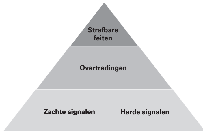
Figuur 2: Indeling naar signalen, overtredingen en strafbare feiten

Deze drie vormen staan met elkaar in verband: signalen kunnen duiden op overtredingen en die kunnen een indicatie zijn van strafbare feiten.