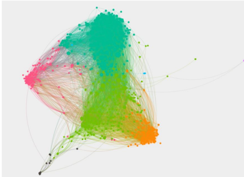
Figuur 1 - Netwerkvisualisatie Twitternetwerk rond sexting en exposing

De belangrijkste clusters of groepen 'twitteraars' over dit onderwerp zijn: 1) kennisinstellingen en personen in de zorg- en welzijnshoek; 2) (veelal rechts georiënteerde) individuen die uitspraken doen over met name doxxing; en 3) vakmedia, correspondenten, schrijvers, politici en journalisten. Het belang van deze groepen wordt bepaald door hun positie in het netwerk en de omvang van hun netwerk.